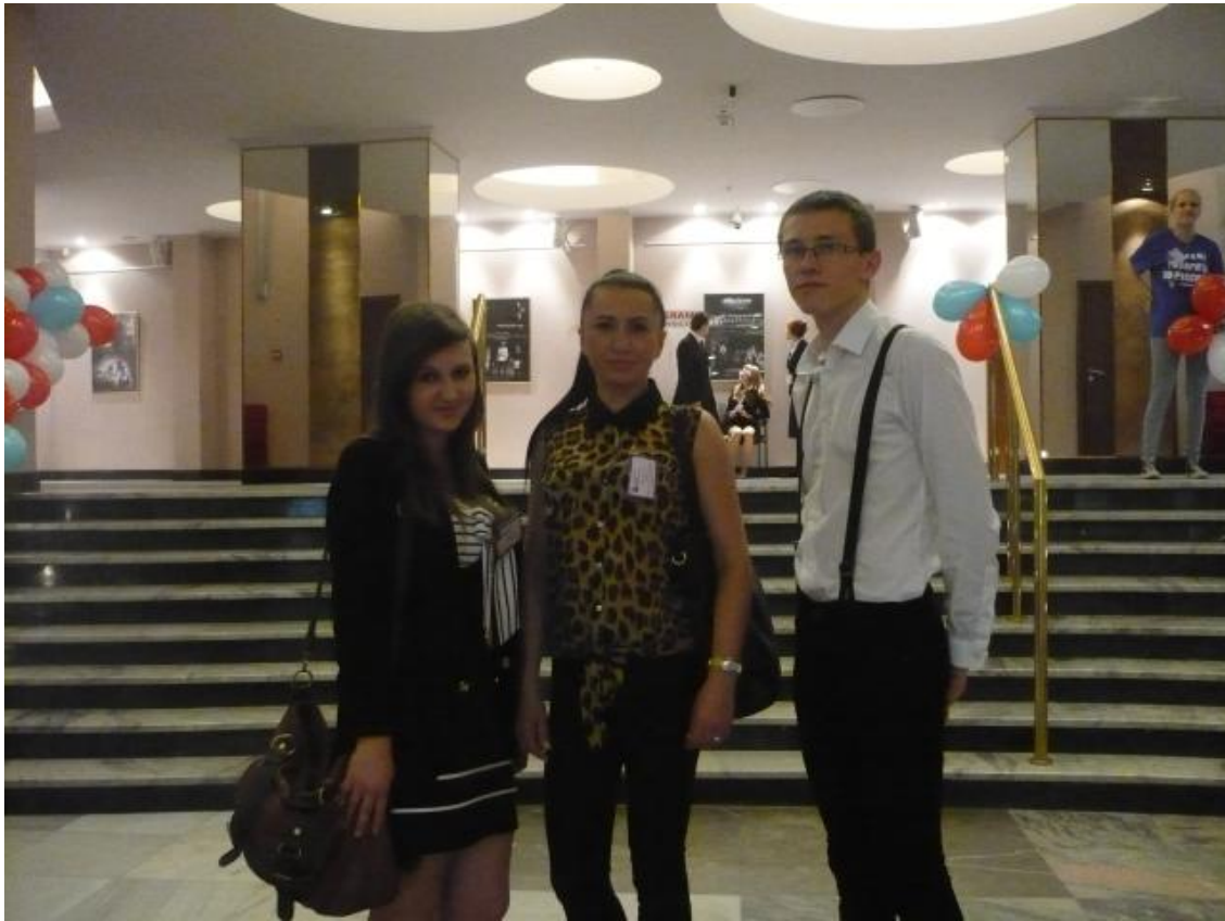
Kilka fotek na pamiątkę...