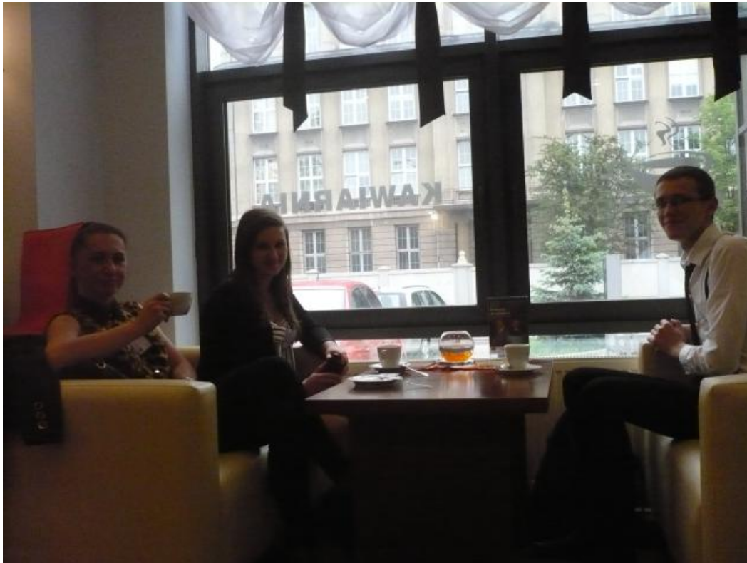
Wieczorem- Manufaktura... Zakupy, rozrywka- co kto chciał...