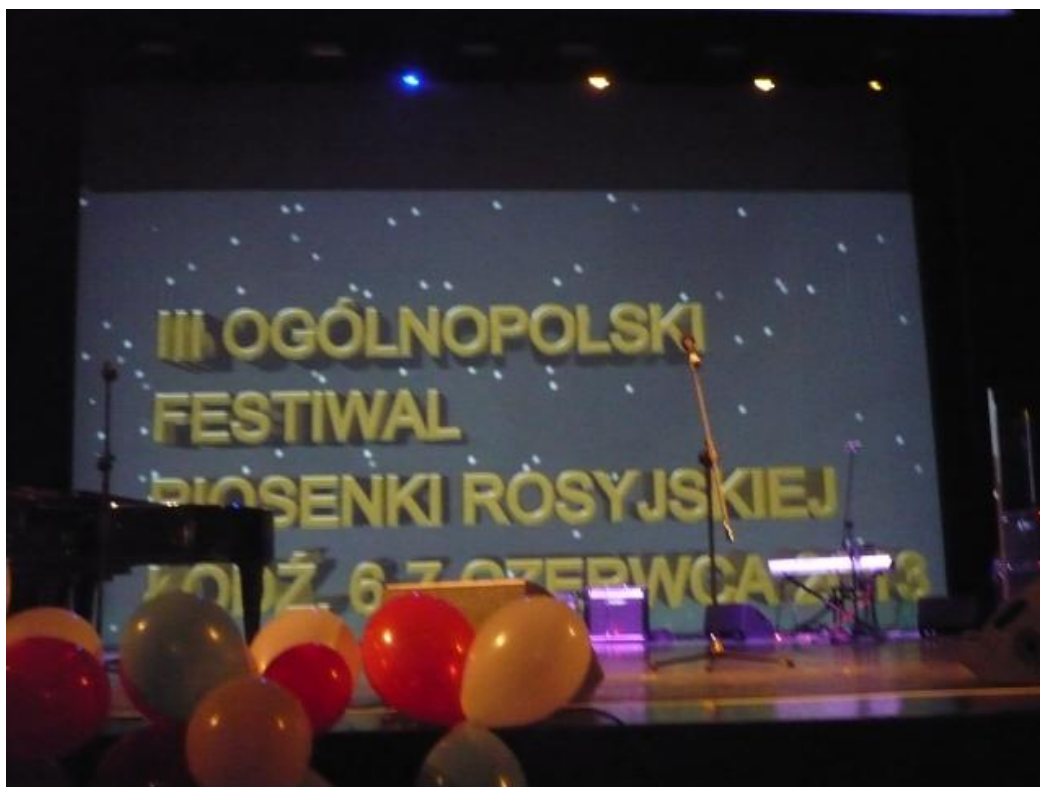
Temat Festiwalu związany był z poetą rosyjskim- Aleksandrem Siergiejewiczem Puszkinem